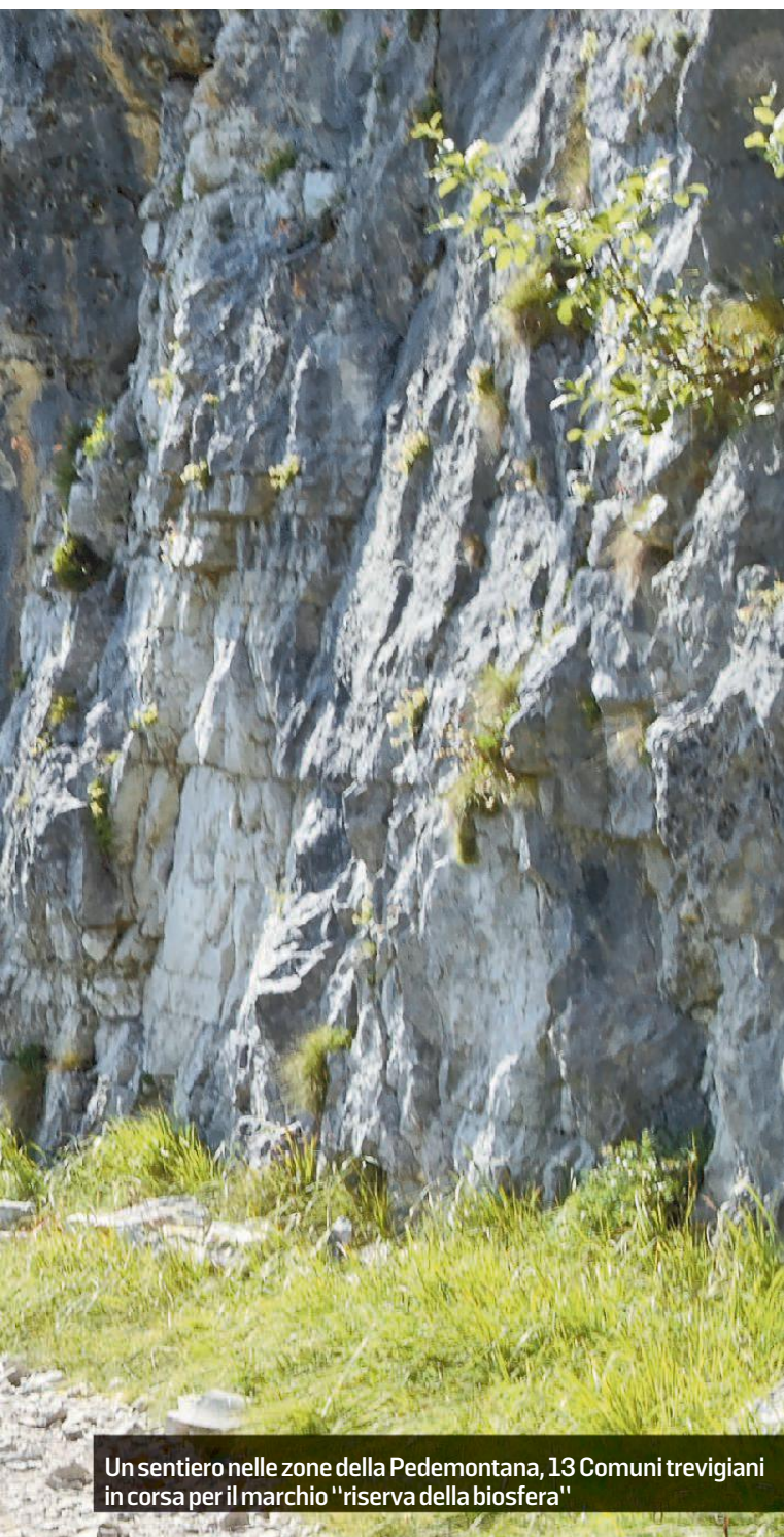
Un sentiero nelle zone della Pedemontana, 13 Comuni trevigiani in corsa per il marchio "riserva della biosfera"